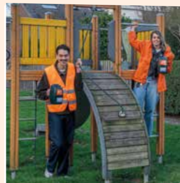
Ook de medewerkers van Jantje Beton gingen op pad!