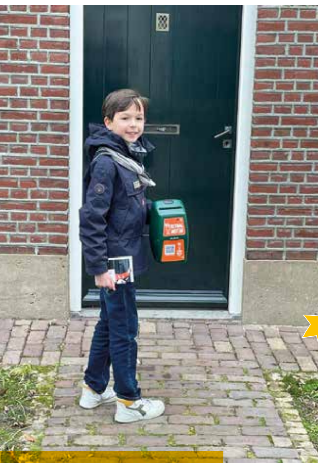
Daylano uit Berkel-Enschot

Deze scoutinggroep spaart voor een nieuwe kampvuurkuil. Een belangrijk onderdeel van het scoutingleven! Hier worden verhalen verteld, liedjes gezongen en vriendschappen gesmeed. Alle kinderen van jong tot oud kunnen zo genieten van een veilige en gezellige kampvuurervaring!