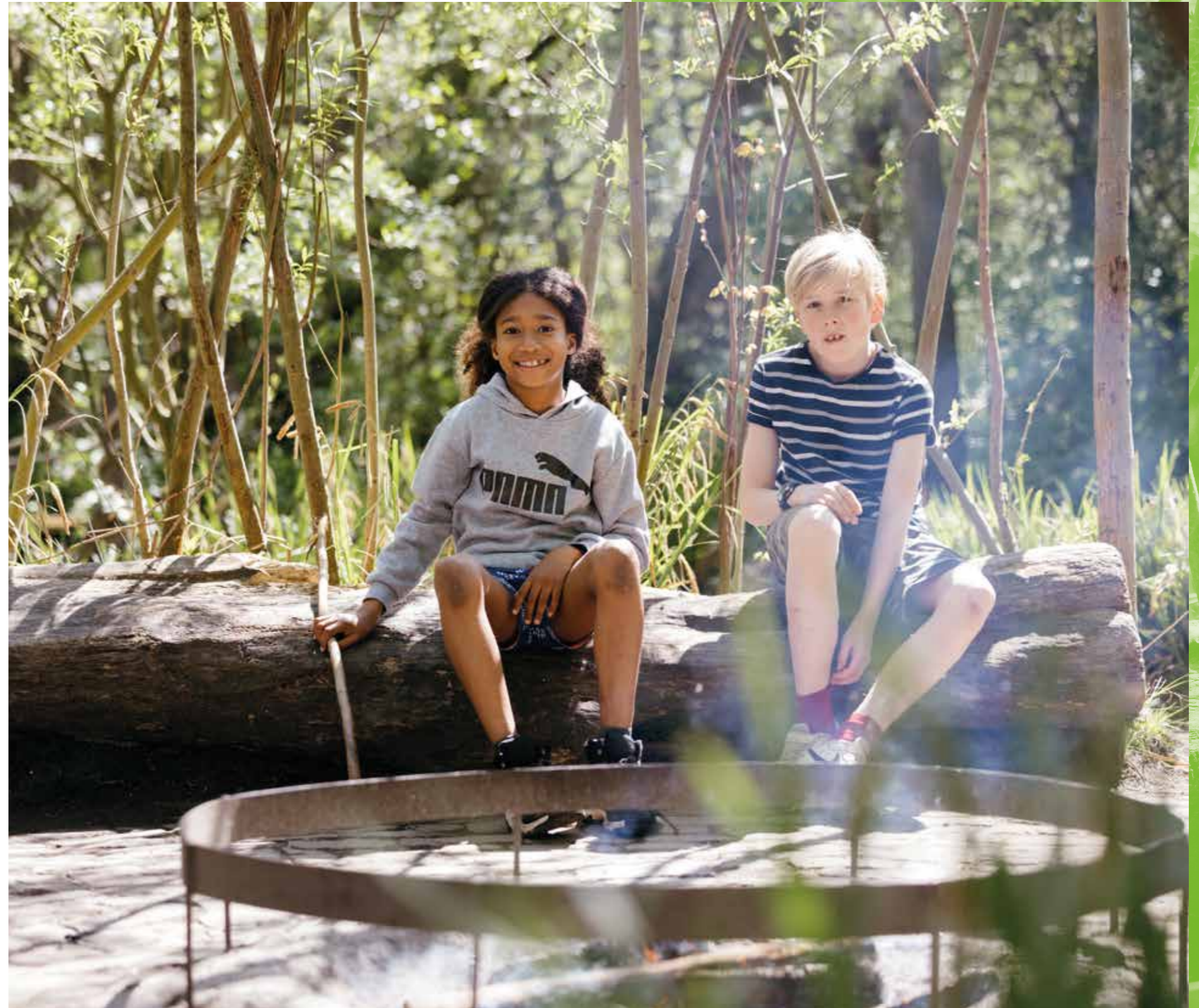
Natuurspeeltuin de Speeldernis

Wij blijven ons inzetten voor compensatie vanuit de overheid voor alle speeltuinen en houden jullie op de hoogte via de LOS nieuwsbrief.